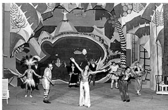
O Rei da Vela, 1967.