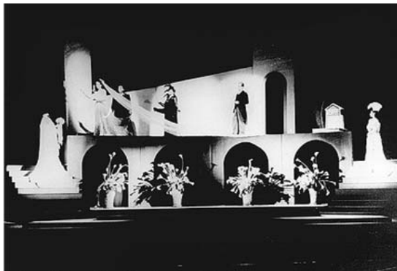
Vestido de Noiva, 1943.